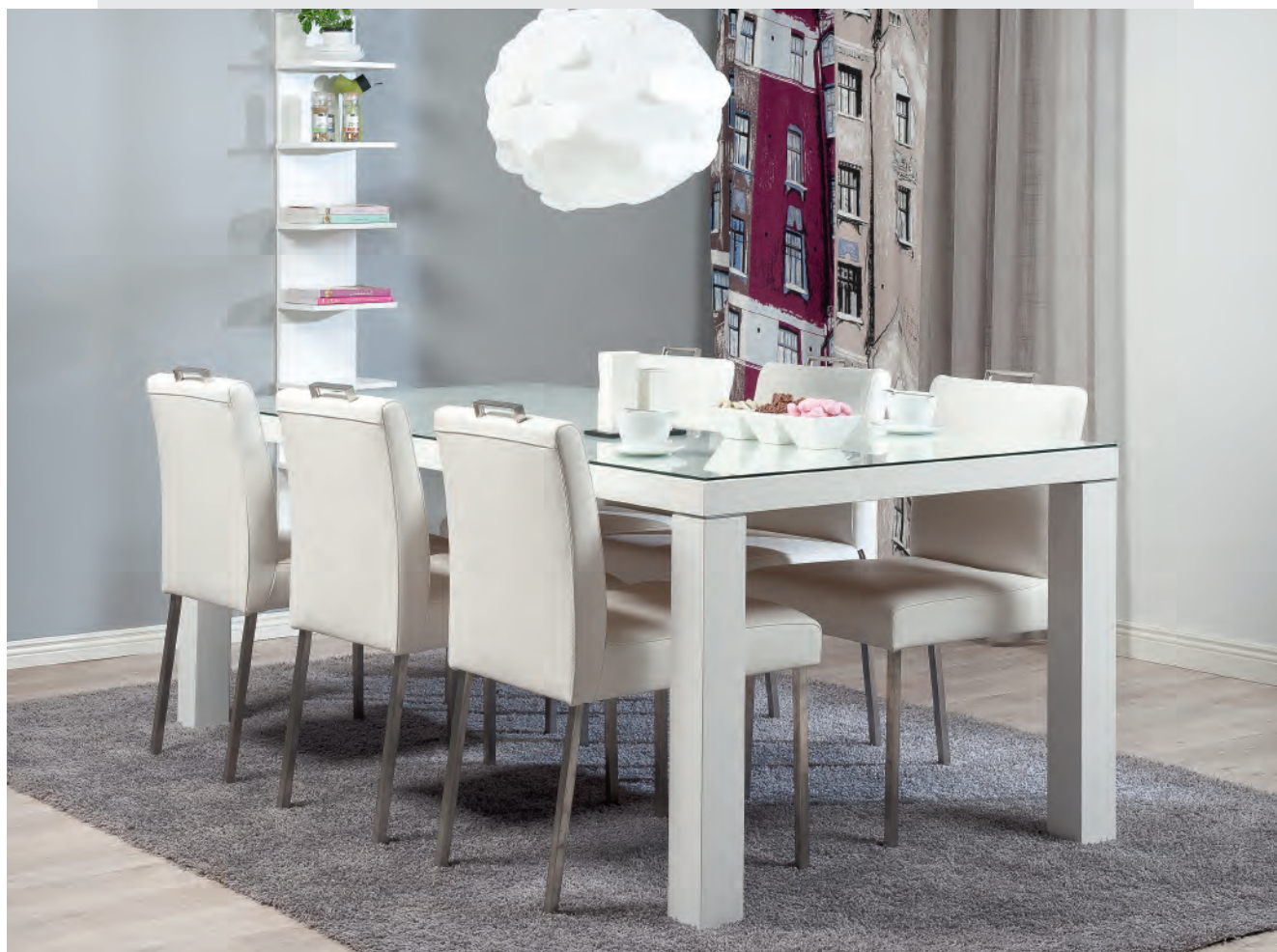
На фото стулья KUURA